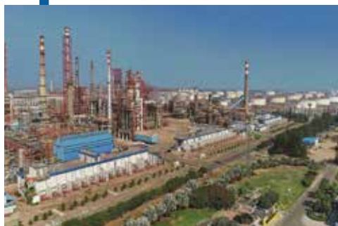
नायरा एनर्जी प्रा. लिमिटेड