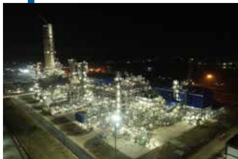
हिन्दुस्तान उर्वरक एंड रसायन लिमिटेड