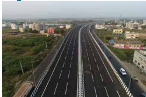
टोल ऑपरेट ट्रांसफर