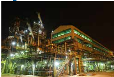
रामागुंदम फर्टिलाइजर एंड केमिकल लिमिटेड