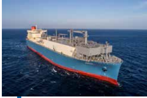
ट्रिम्फ ऑफशोर प्रा. लिमिटेड